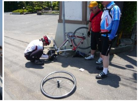
長田車パンクトラブル