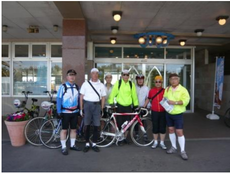
犬吠埼ホテル出発前