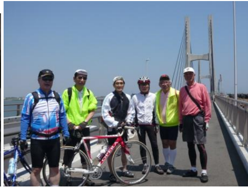
銚子大橋 銚子から神栖市へ