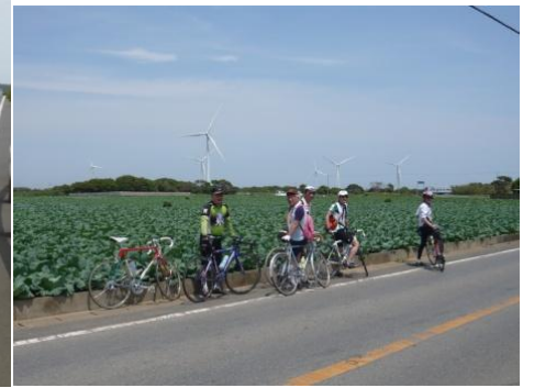
銚子キャベツ畑と風力発電