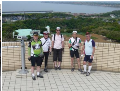
地球のまるく見える丘公園展望館