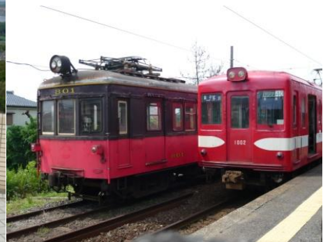
ぬれ煎餅の銚子電鉄丸ノ内線お下がり