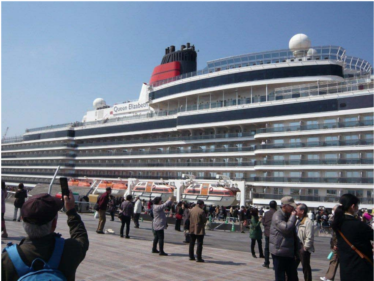
どう見ても船には見えません ホテルニューオータニ？