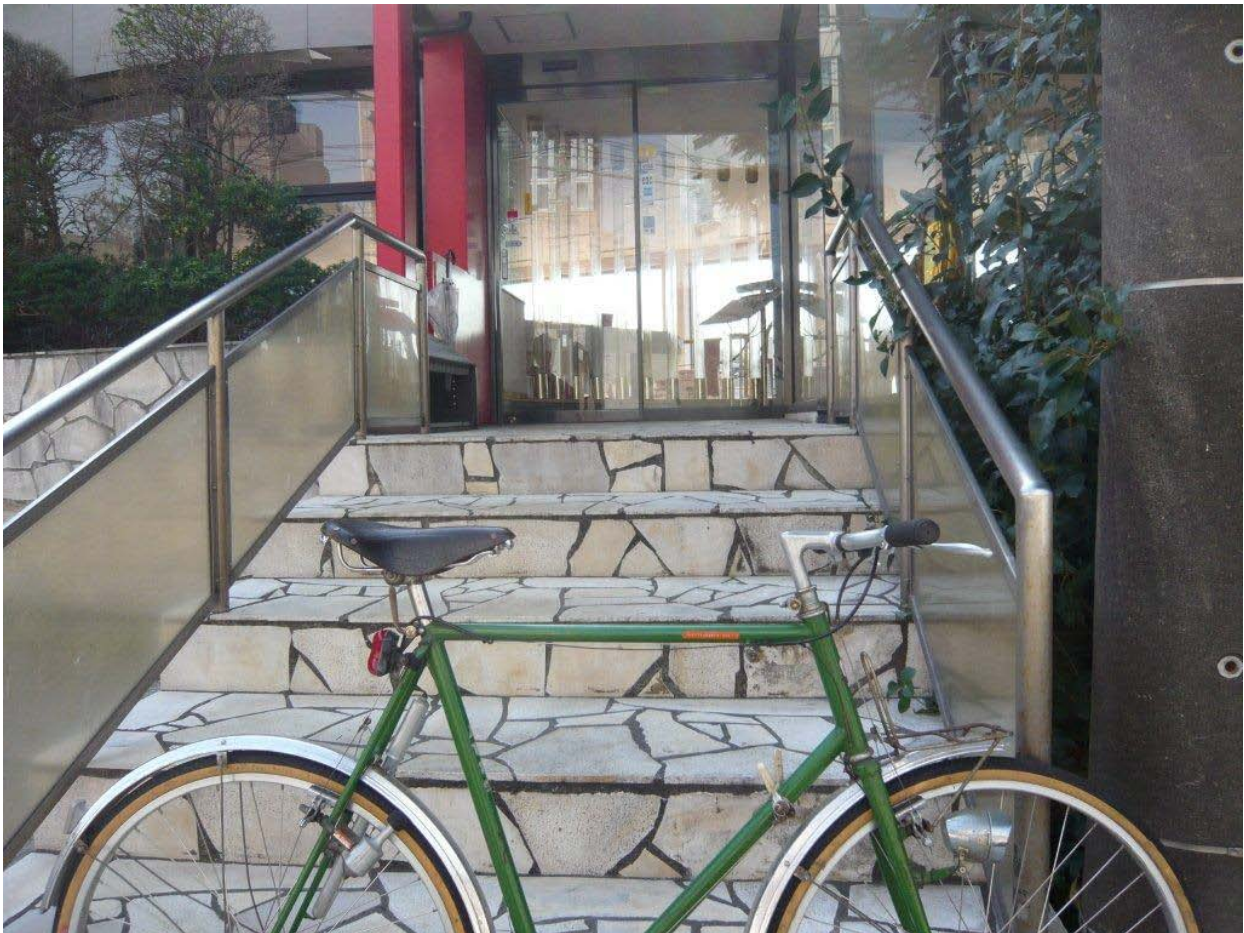
荒井由美の Dolphin 今は海がよく見えません