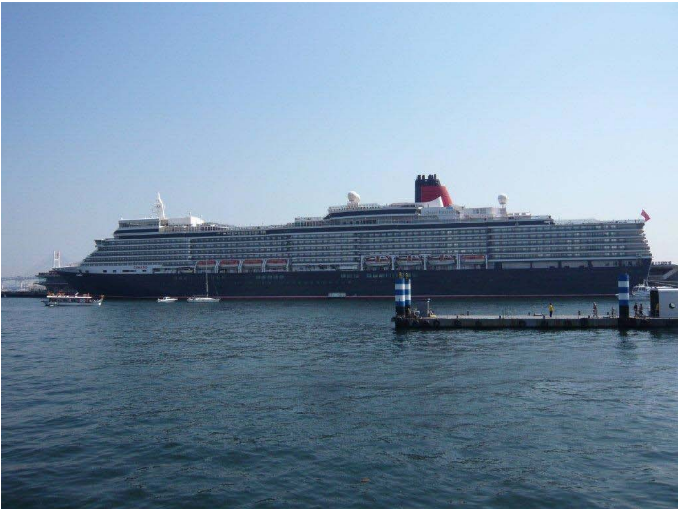
赤レンガ倉庫から見た全景