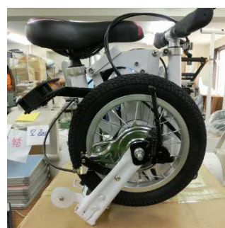
左側に前輪 右側に後輪