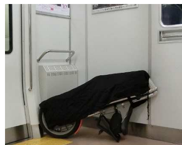
Smart Fit を手にする前 2014 年までの出張では STRIDA II を活用