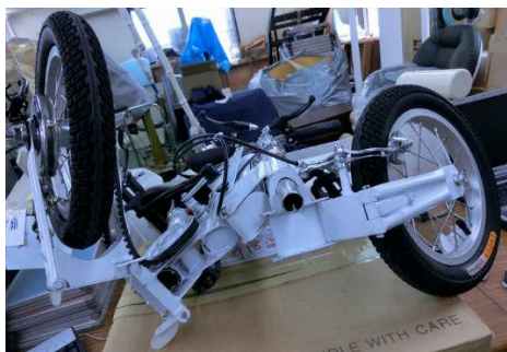
折畳み③ 前輪&後輪交互にをたたむ