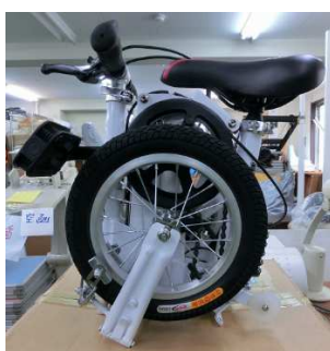
一辺 30cm のキュービックボックス