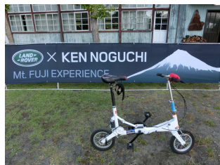
野口健君と富士山清掃活動