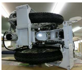
下から 車輪を蝶番で畳む