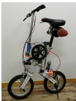
折畳み①車体をたたむ