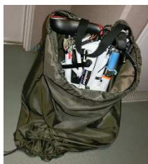
簡易輸行ナイフ袋