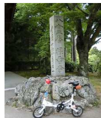
お遍路香川 82 番札所