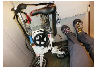
ずばら輸行肩掛ストラップのみ