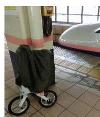
手抜き輸行ナイフ袋被せただけ