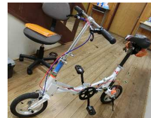
動脈静脈のブレイキヤ