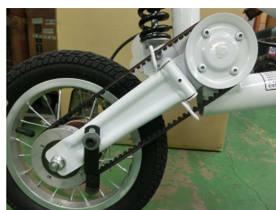
後輪の折畳み蝶番部