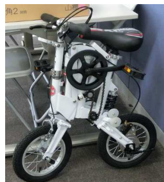
折畳み②ハンドル-をつぼめバルを下げる